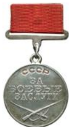
МЕДАЛЬ ЗА БОЕВЫЕ ЗАСЛУГИ