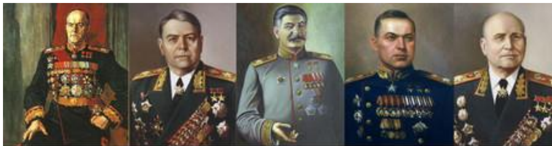
Маршал Г. К. Жуков