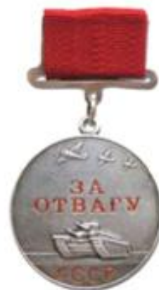
МЕДАЛЬ ЗА ОТВАГУ