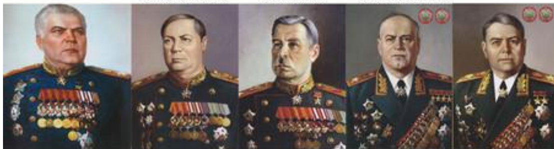
Маршал Р. Я. Малиновский