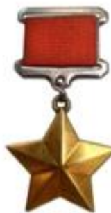
МЕДАЛЬ ЗОЛОТАЯ ЗВЕЗДА ГЕРОЯ СОВЕТСКОГО СОЮЗА